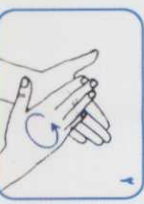
۱ کف دست‌ها را به هم بمالید.

مدت زمان شستن دست‌ها با آب و صابون ۴۰ تا ۶۰ ثانیه است.