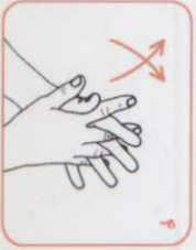
۵ کف دست‌ها و بین انگشتان را به هم بمالید.