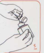
۲ یک کف دست را از محلول کمتر پر کنید.