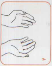
۷ صبر کنید دست‌ها خشک شوند. حال دست‌های شما تمیز هستند.