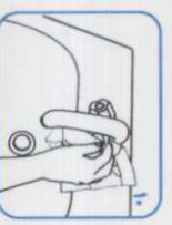
۱۱ از همان جویه برای بشستن آب استفاده کنید.