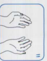
۱۰ حال دست‌های شما تمیز هستند.