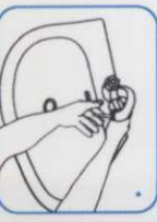
۳ دست‌ها را با آب فیس کنید.