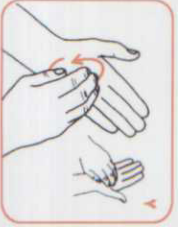
۸ کف دست چپ را بصورت چرخشی با انگشتان هم فاصله دست راست بمالید. این عمل را با دست دیگر نیز انجام دهید.