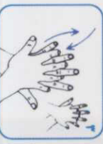
۶ کف دست راست را به پشت دست چپ و این انگشتان به‌هم‌چنین عمل را دست دیگر نیز انجام دهید.