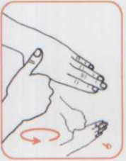
۹ دست چپ را به صورت چرخشی توسط کف دست راست بمالید. این عمل با دست دیگر نیز انجام شود.