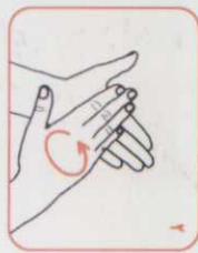
۱ کف دست‌ها را به هم بمالید

مدت زمان برای مالش دست‌ها ۲۰ تا ۳۰ ثانیه است.