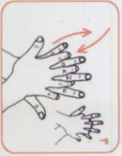
۶ کف دست راست را به پشت دست چپ و این انگشتان بمالید. این عمل با دست دیگر نیز انجام شود.