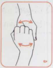
۴ پشت انگشتان را به حالت خم شده به کف دست دیگر بمالید.