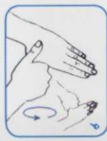
۹ دست چپ را به صورت چرخشی توسط کف دست راست بمالید. این عمل با دست دیگر نیز انجام دهید.