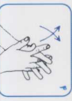
۵ کف دست‌ها و بین انگشتان را به هم بمالید.