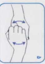
۴ پشت انگشتان را به حالت خم شده به کف دست دیگر بمالید.