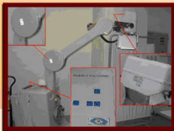
شکل ۲- رادیولوژی پرنابل (محفظه تیوب، بازو و میز فرمان)