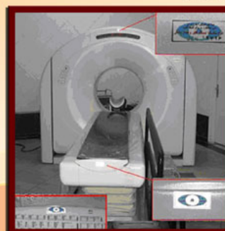
شکل ۴- سی تی اسکن (کانتبری، بدنه و میز فرمان داخل اتاق کنترل)