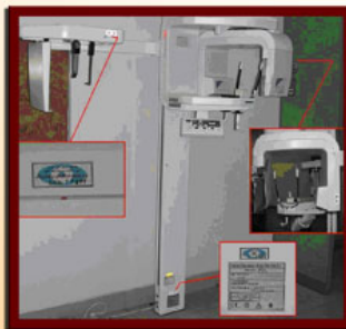
شکل ۶- سی آر ام (محفظه تیوب، بازو و میز فرمان)