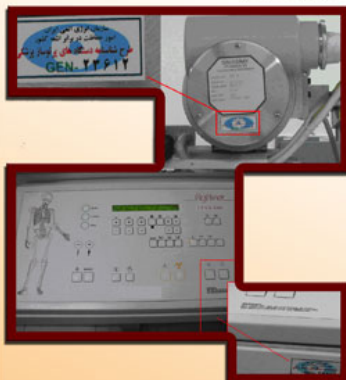
شکل ۲- رادیولوژی پرنابل (محفظه تیوب، بازو و میز فرمان)