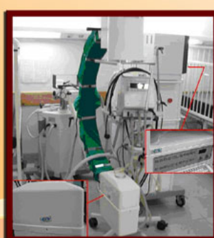
شکل ۶- سی آر ام (محفظه تیوب، بازو و میز فرمان)